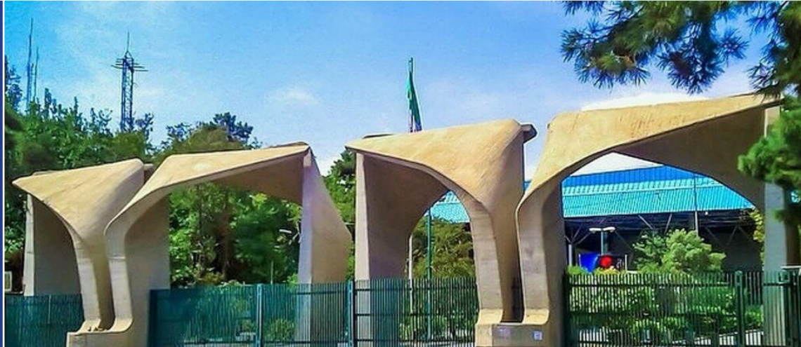
تصویب قانون تأسیس دانشگاه تهران