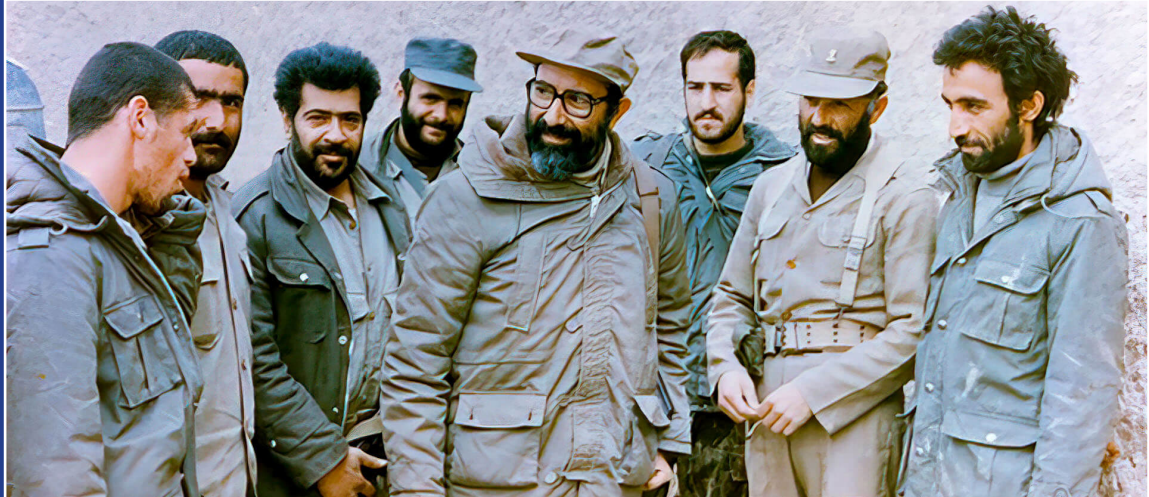
شهادت دکتر مصطفی چمران / روز بسیج استادان