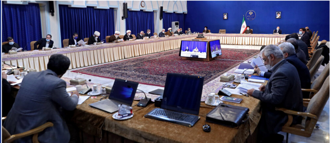
سالروز اعلام انقلاب فرهنگی